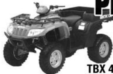
TBX 4X4 400/650 2007

Un VTT de style pick-up à quatre roues motrices