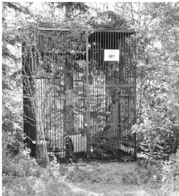
C'est d'abord dans cette petite cage que les ours évolueront avant d'être transféré dans un enclos reproduisant leur habitat naturel.