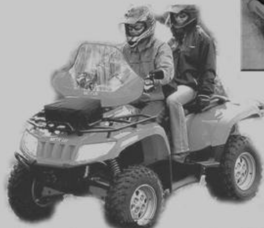
650 automatique 4x4 2007