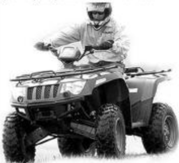
700 Automatique 4X4 2007 EFI

Un VTT de style pick-up à quatre roues motrices